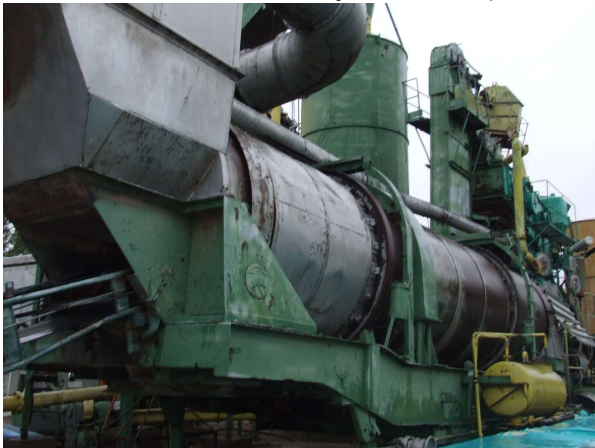
Fig 7 – la momentul cumpararii statiei

Uscatorul va fi modernizat, reparat si va fi alimentat cu CTL /sau gaze naturale.