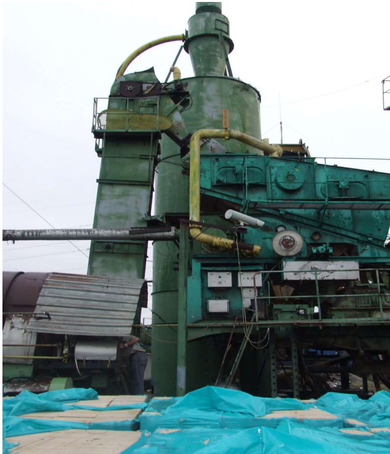
Fig 1 – existenta

Componenta statiei de preparat mixturi asfaltice este urmatoarea: