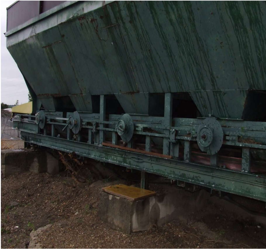
Fig 3 – la momentul cumpararii statiei