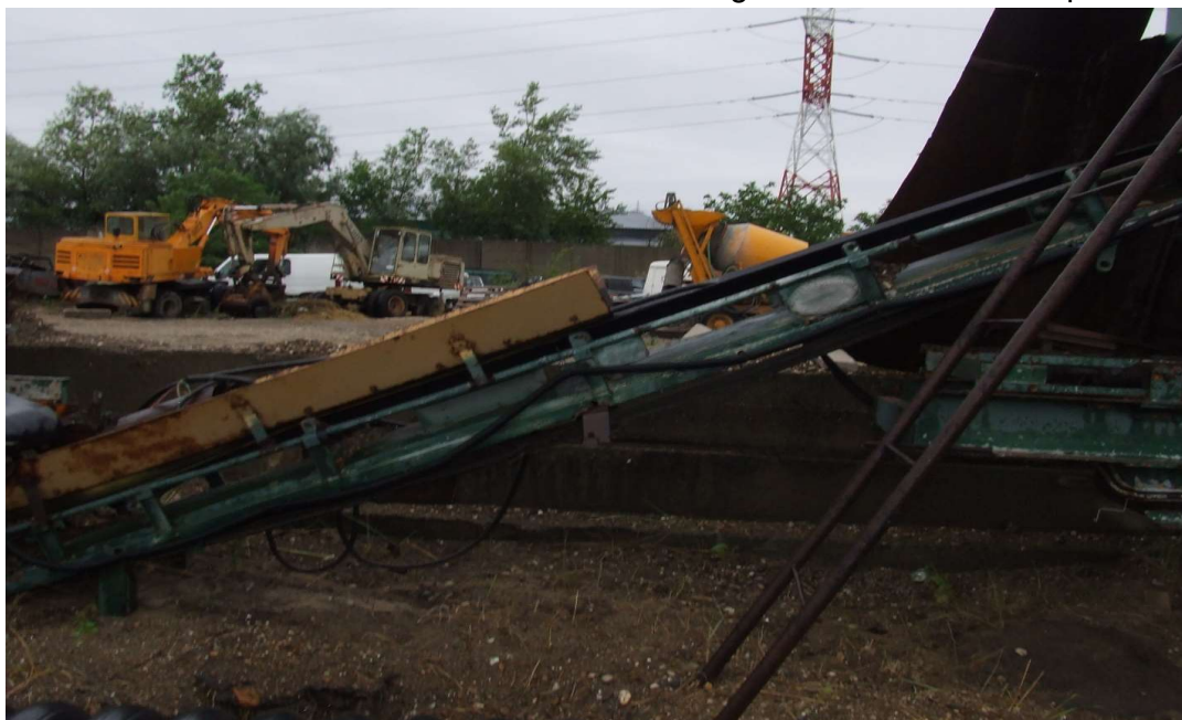
Fig 5 – la momentul cumparării statiei